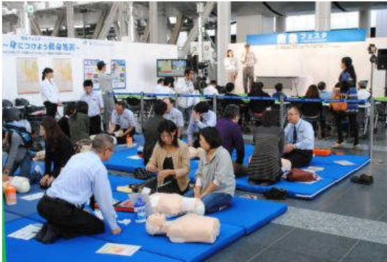
(昨年のおお阪駅での様子)

日本では年間に約 6.5 万人、1 日約 180 人の方が心臓突然死で亡くなっています。当財団は、「救急現場に居合わせた時の救命処置」の重要性を広く啓発し、心肺蘇生法等の知識・技能や方法を習得していただく活動を通して「安全で安心できる社会」の実現に少しでも寄与できればとの思いで救急フェアを開催しています。平成 22 年度から開催しており J R の駅のべ 31 箇所を実施し、救命処置の体験者は約 2,100 人に上っています。また、最近は学校内にも A E D が整備され、授業の一環として普通救命講習等を取り入れる学校が増加しています。今回救急フェスタ in 京都において初めて開催致します「いのちのリレー大会」が児童、生徒がいのちと向き合う良い機会になるとともに、大会をご覧になった同世代をはじめ、幅広い年代の方に興味を持っていただく機会になればと考えております。