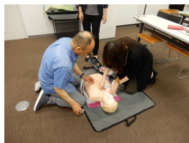
2019年度助成先団体の活動の様様