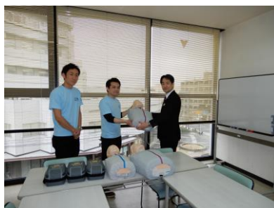
2019年度助成先への贈呈の様様