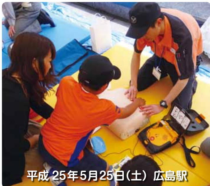
平成 25年5月25日(土) 広島駅