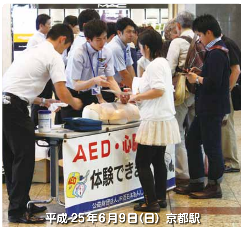
平成 25年6月9日(日) 京都駅