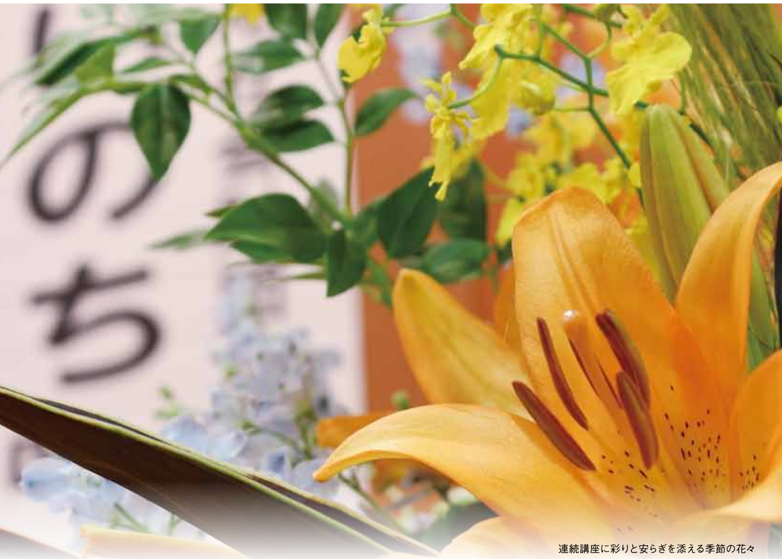
連続講座に彩りと安らぎを添える季節の花々