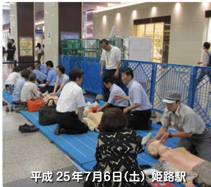
平成 25年7月6日(土) 姫路駅